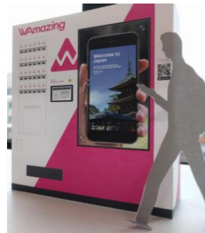
免费SIM卡领卡机 (示意图)