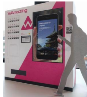
免費SIM卡領卡机 (示意圖)