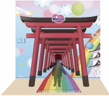
トリックアートイメージ（左から鳥居、桜）

キッズパークには日本的な風景のデザインを施しています。日本の旅をテーマにした複数のトリックアートや、赤ちゃんの寝相アートを撮影できるスペースなど、たくさんのフォトスポットが設置されています。