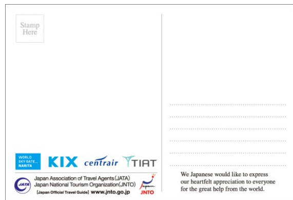
<ポストカード記入面>