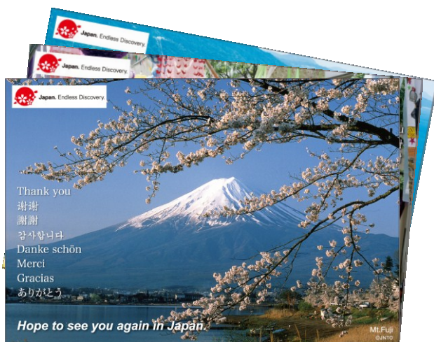
<ポストカード絵柄面>