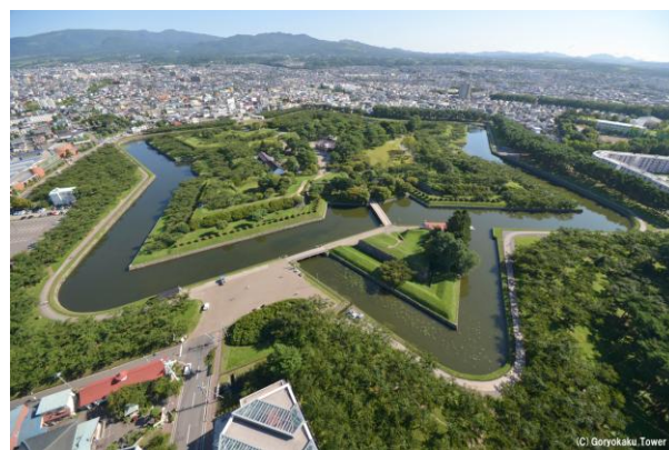
<五稜郭タワー展望台から見る眺望>