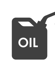
ガソリン・燃料 灯油等