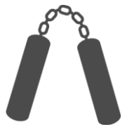
殺傷性のあるもの