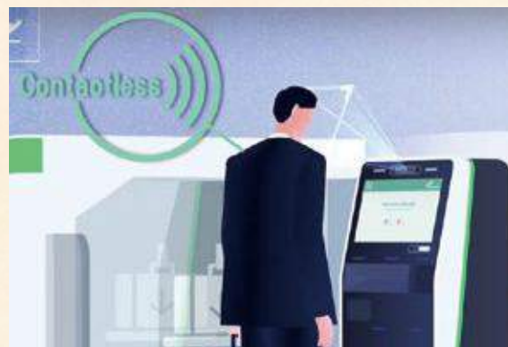
サービスの利用登録は、自動チェックイン機のほか、自動手荷物預け機・保安検査場の入口でも可能です。

7月から、顔認証技術を活用した新たな「Face Express」がスタート予定。国際線自動チェックイン機など、空港での最初の搭乗手続きで顔画像も登録。その後の手続きでパスポートや搭乗券を提示する必要がなくなり、搭乗ゲートでは「顔パス」で通過できるようになります。高精度の認証技術で「なりすまし」を防ぐほか、手続き時の接触リスクも軽減。また各所で要した時間が短縮され、空港で過ごす時間がより有意義に。旅のはじまりが、安心・安全・快適なひとときになります。