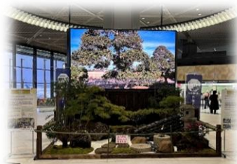
※昨年度に実施した展示の様子です

【しおり制作体験】 2月12日（木）～ 13日（金）10:00～15:00 『房総のむら』の協力によるオリジナルしおり作り体験も同時にお楽しみいただけます。