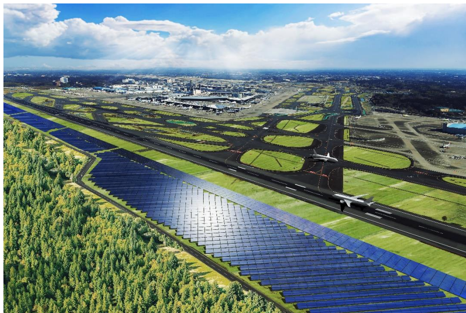
太陽光発電設備設置イメージ