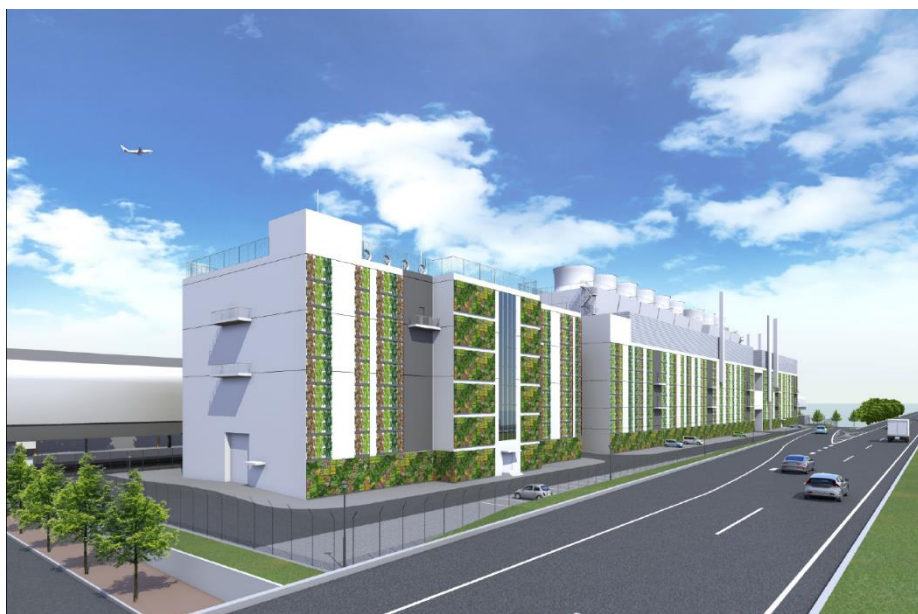
新プラント完成予想図