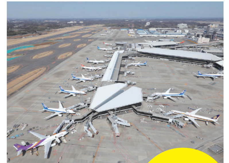
空港の機能拡張を実現するのが整備部

空港ではターミナルビルや航空機の駐機場といった施設を拡充したり、増強したりするための工事が常に行われています。そうした工事の計画から完成までのまとめ役を担うのが整備部です。旅客だけでなく航空会社などさまざまな空港利用者に配慮して設計会社と調整し、受注した施工会社が間違いのない工事を行うよう管理・監督します。空港整備のプロとして知恵を絞りながら、空港の価値向上を形にしていくな仕事です。