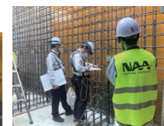
空港整備のプロの目線で施工を確認します