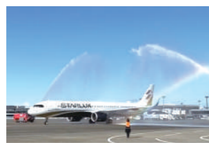
新規就航のウォーターサルート