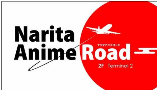
「成田アニメロード」ロゴデザイン

全長60m以上の通路壁面に日本の人気アニメキャラクターが勢ぞろい。全世界にファンが広がる日本のアニメ作品の中から海外でも人気の高い作品のキャラクターが、日本の美しい四季それぞれの象徴的な光景をバックにお客様をお出迎えします。アニメの国・日本に来たことを実感できるここだけの旅の記念が残せるフォトスポットです。