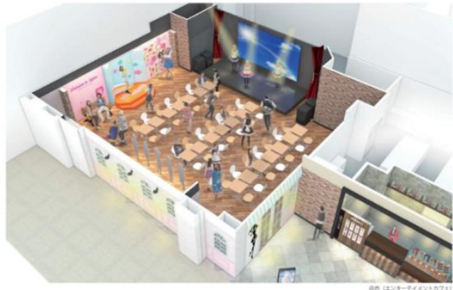
エンターテインメントカフェ 店内イメージ

クールジャパンのおもてなしサービスが味わえる複合型カフェでは、かわいいメイドさんたちがお出迎えしてくれます。旅の思い出作りや癒しにピッタリなおムライスのお絵かきメニューや、人気アニメのコラボメニューなどエンターテインメントが味わえます。