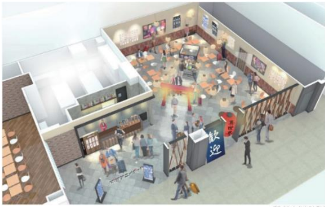
イートインレストラン 店内イメージ

非日常を感じられる「日本のお祭り」がテーマです。店内は、巨大な提灯やのれん、真っ赤な鳥居や花火といった“海外から見た日本”をイメージしたインテリアです。飲食メニューの提供はフードコート形式で行い、お祭りの会場にいるような賑わいを演出します。