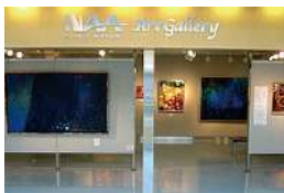
NAA 藝術畫廊 6:00-22:00

眺望連廊 由於天氣等原因， 即使在使用時間內也有關閉的情況。 6:30-21:00 (4/1-9/30) 7:00-21:00 (10/1-3/31)