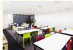
▲ C-1 46席 / 69㎡

Narita International Airport RENTAL LOUNGE also available