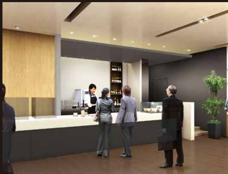
ビバレッジカウンター Beverage counter

Enjoy a moment before departure with a coffee in hand, watching the aircraft arrive and depart.