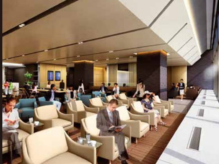
リビングスペース Lounge space

航空機が離着陸する臨場感を味わいながら、 コーヒーを片手に搭乗前のひとときを——。